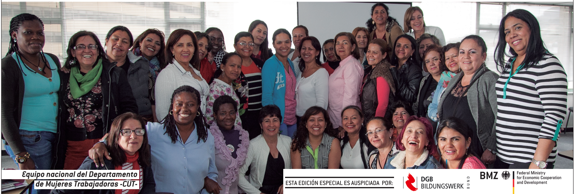
Equipo nacional del Departamento de Mujeres Trabajadoras -CUT-

ESTA EDICIÓN ESPECIAL ES AUSPICIADA POR: