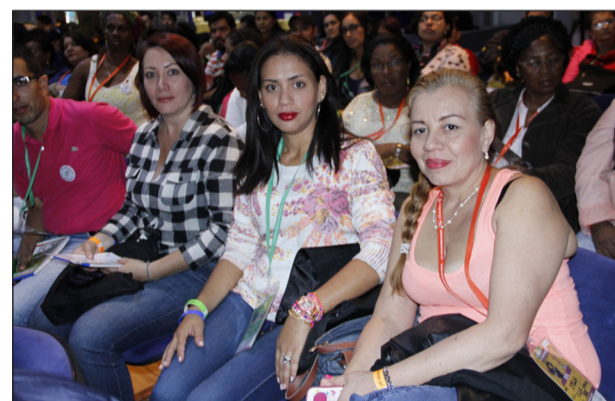
Aspectos principales de la instalación del V Congreso de la Mujer y el II Congreso de la Juventud Trabajadora, con la participación de más de 600 delegados de todo el país y la presencia de delegaciones internacionales.