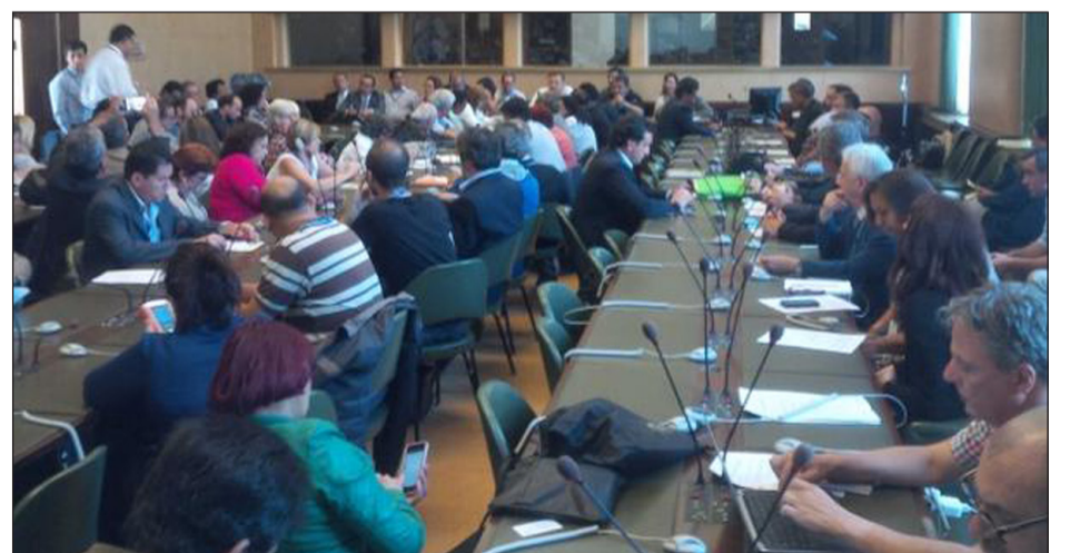
Reunión de delegados de la CSA en la OIT reclamando trabajo decente y protestando contra empleadores por negar huelga.