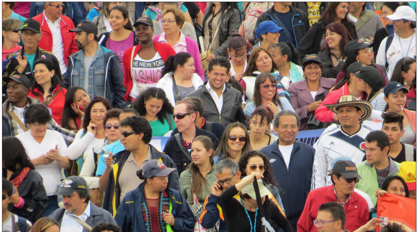
Masivas manifestaciones a nivel nacional.

Por la realización del Encuentro Nacional cultural y folclórico que lleva a cabo Fecode cada año, se destinará un monto de $1.000 millones en 2016, $1.500 millones en 2017 y $1.500 millones en 2018, los cuales ejecutarán en coordinación con