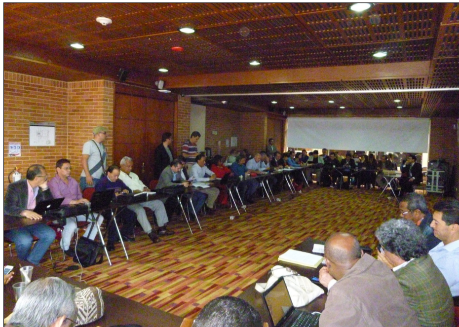
Comité Ejecutivo CUT Nacional y Fecode evaluando los acuerdos.

El Gobierno Nacional continuará adelantando las gestiones que se requieran para dar cumplimiento a los acuerdos suscritos, entre otros, con los sindicatos del Instituto Nacional de Medicina Legal, Dian, Aerocivil, Icbf y Sena, en materia de ampliación de plantas de personal y los