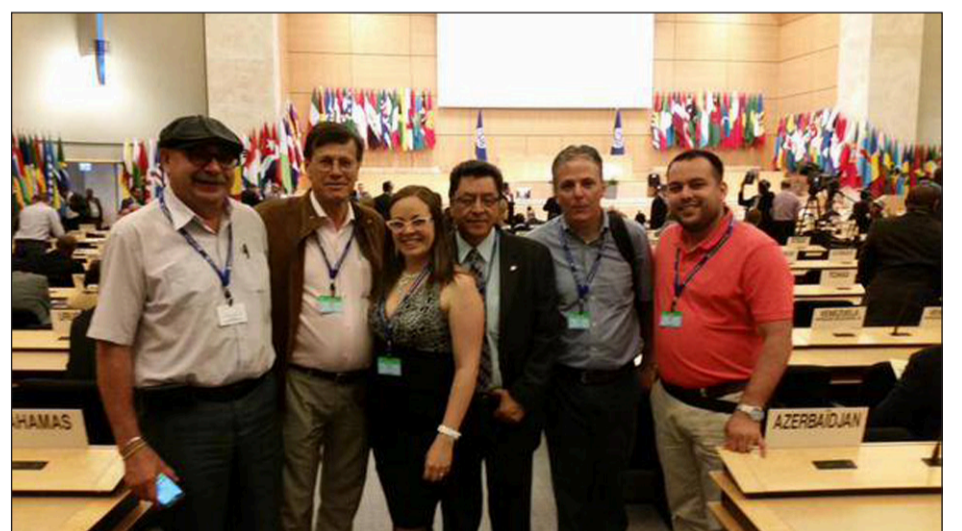
Delegación de colombianos en la OIT, Ginebra, Suiza.