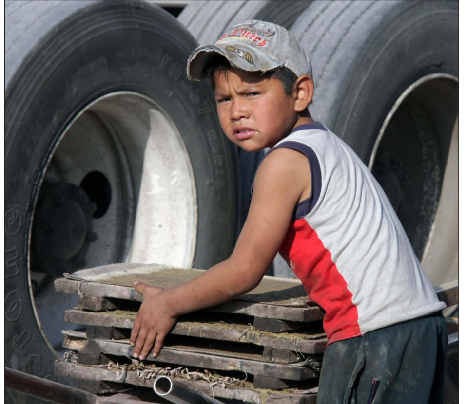
La CUT se compromete en su lucha contra el trabajo infantil.

Durante el 2013, la investigación levantó la información de los principales corredores entre Bogotá y municipios turísticos como Girardot, La Mesa y Villeta, que son donde se concentran las redes de explotación sexual de menores de edad. Los municipios con las cifras más altas de trabajo