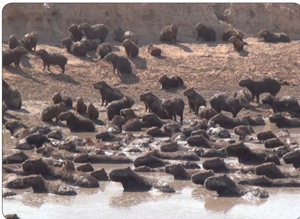
Tragedia ambiental en el Casanare.

Unas de las perlas de depredación del Medio Ambiente, tienen que ver con la desviación del Río Ranchería en la Guajira, la construcción de la Hidroeléctrica El Quimbo y las legendarias minas de Marmato, por ahora se encuentra frustrado el interés de la AngloGold, gracias a la resistencia civil frente a la pretendida apertura de La Colosa, calificada como que podría ser la mina de oro a cielo abierto más importante de América. La