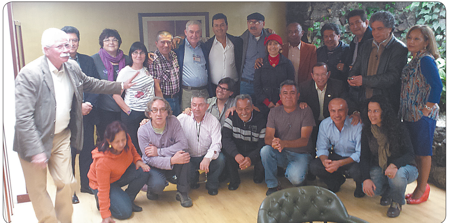
El Comité Ejecutivo de la CUT con sindicalistas europeos de Irlanda y Cataluña.

5. En relación al conflicto armado se han recogido continuas denuncias de violaciones al Derecho Internacional Humanitario, como la falta de respeto del principio de distinción entre combatientes y civiles, la ubicación de instalaciones militares en el centro de los cascos urbanos de las poblaciones o en la cercanía