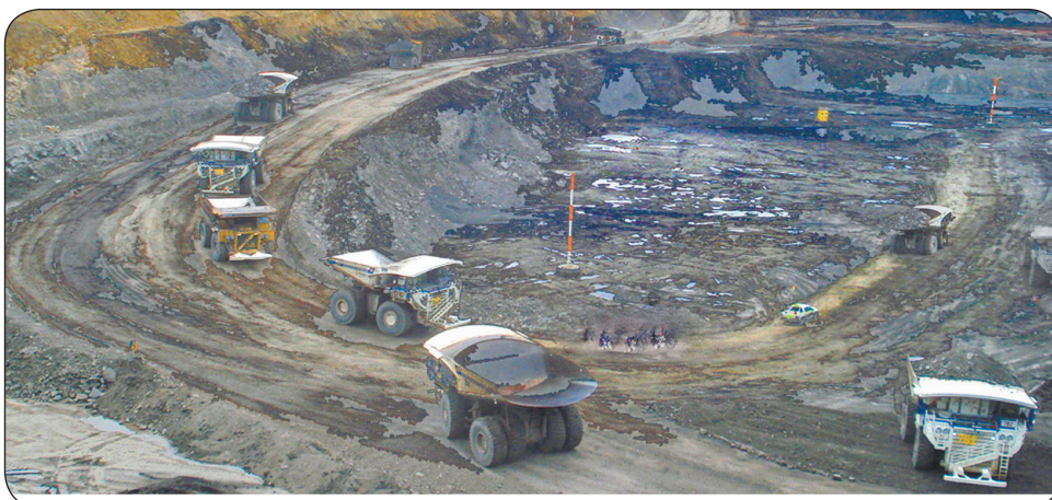
Explotación de carbón en El Cerrejón.

población del municipio de Piedras descarriló la locomotora Mineroenergética con el estandarte de la AngloGold mediante una consulta popular que con el NO, tiene detenida la multinacional Sudafricana y protegida por ahora la inmensa reserva forestal productora de fuentes hídricas muy importantes, a esta cadena de saqueo y muerte de la naturaleza que lleva en sí