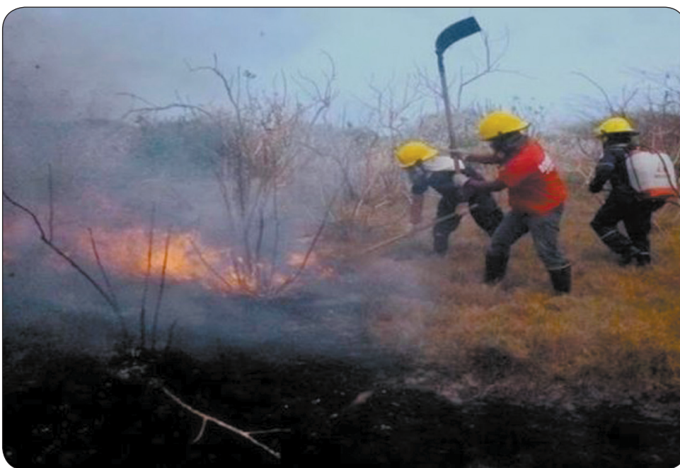
Incendios forestales en la costa Caribe.