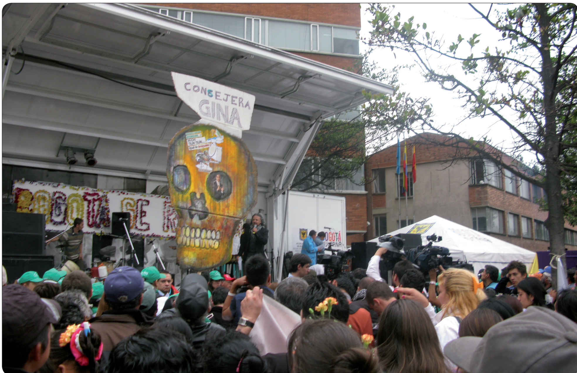
La CUT rechaza la intervención arbitraria a la Empresa de Acueducto y Alcantarillado de Bogotá (EAAB) por parte de la Superintendencia de Industria y Comercio, ya que con dicho acto del Gobierno Nacional sólo busca favorecer los intereses de las empresas privadas de recolección de basuras y reciclaje en Bogotá.