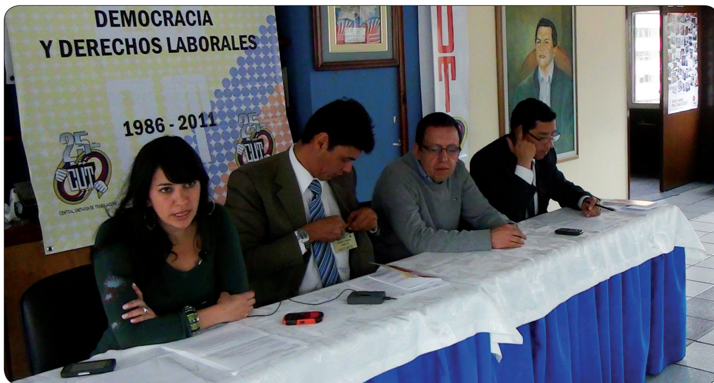
Comité Intersindical de los Trabajadores de la DIAN.

La Clínica San Rafael desde hace más de un año ha dejado de cumplir con las obligaciones con los trabajadores, actualmente nos deben casi tres meses de salario además a algunos les deben la prima de mitad de año y a otros la prima de diciembre extralegal. La situación económica y de subsistencia de los trabajadores en este momento es precaria y desesperada.