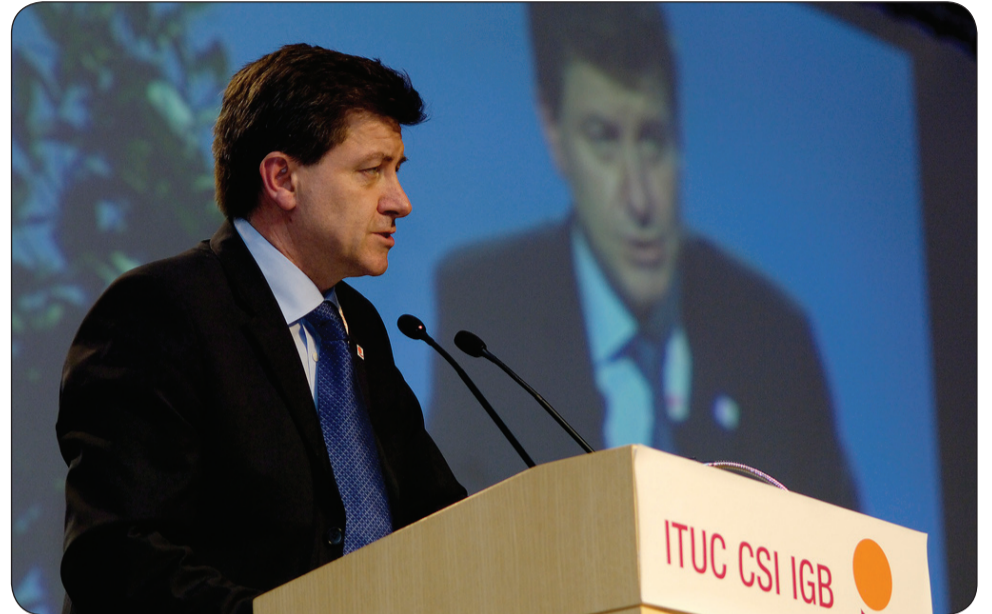
El nuevo director de la OIT, Guy Ryder.

En la OIT, los empleadores están tratando de mantener en secreto las peores violaciones y evitar la vigilancia internacional que podría ayudar a salvar vidas y a hacer frente a algunos de los ataques más atroces a los derechos de los trabajadores y las trabajadoras. El año pasado, fueron asesinados en Colombia 29 sindicalistas, pero los empleadores consideran que la OIT no debería hablar ni siquiera de ello, ni de la terrible campaña de violencia contra los sindicalistas en Guatemala o en Suazilandia. Los egipcios se encuentran en medio de una batalla por sus derechos más básicos a un trabajo decente, pero los empleadores parecen estar del lado de las fuerzas militares y fundamentalistas interesadas en privar de voz a los trabajadores. La Organización Internacional de Empleadores también se ha negado a permitir que se hable de la supresión de los derechos de negociación colectiva en Grecia y España, donde la caída en picada de los ingresos está empeorando la ya difícil situación económica del país, ni tampoco de otros casos graves en los que se violan las leyes del trabajo decente.