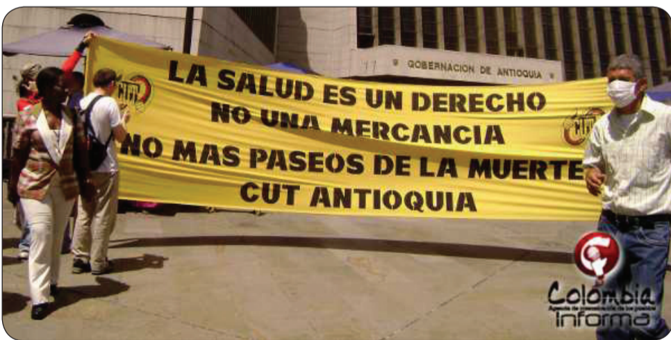
La marcha en Antioquia.