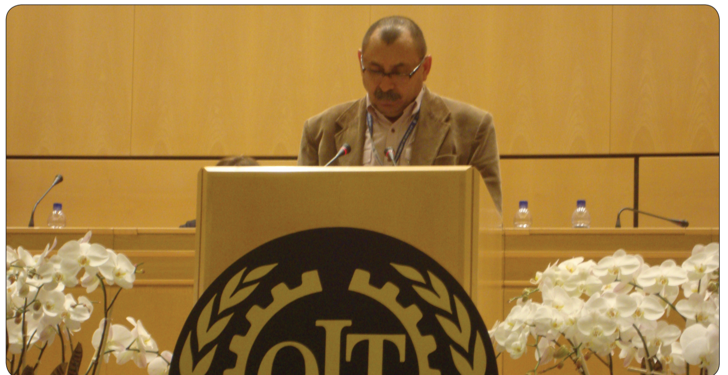
El presidente nacional de la CUT, Domingo Tovar Arrieta, durante su intervención en la plenaria de la OIT.

En la OIT, los empleadores están tratando de mantener en secreto las peores violaciones y evitar la vigilancia internacional que podría ayudar a salvar vidas y a hacer frente a algunos de los ataques más atroces a los derechos de los trabajadores y las trabajadoras.