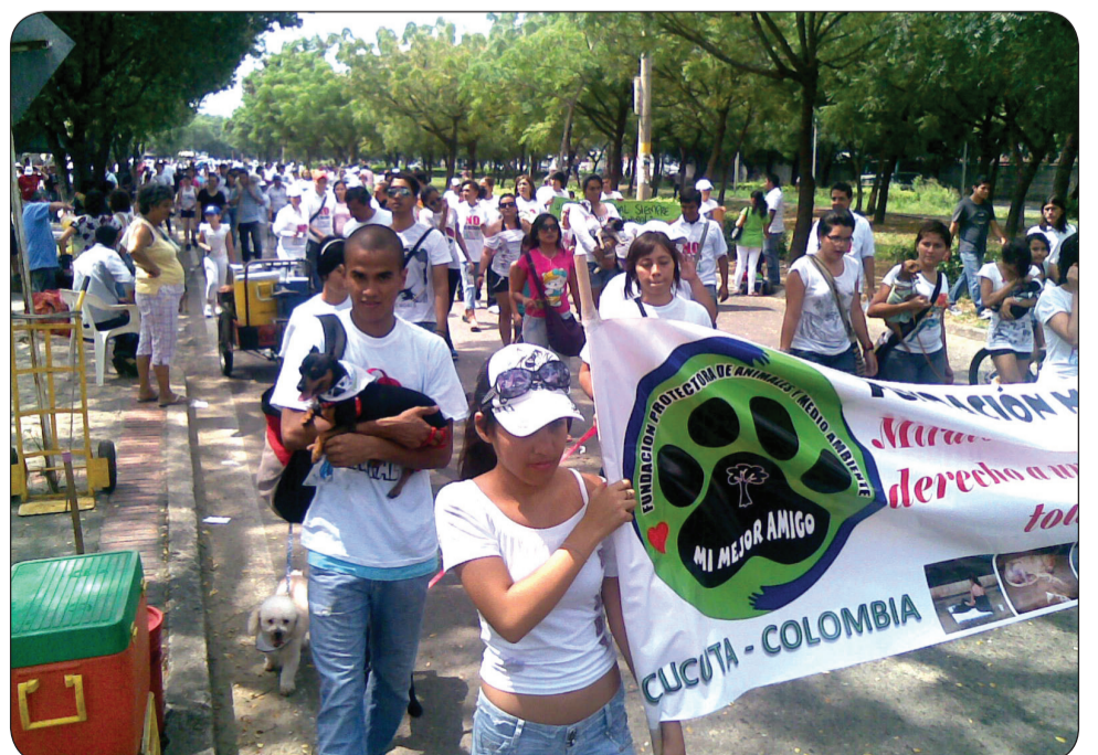
La marcha en Cúcuta.