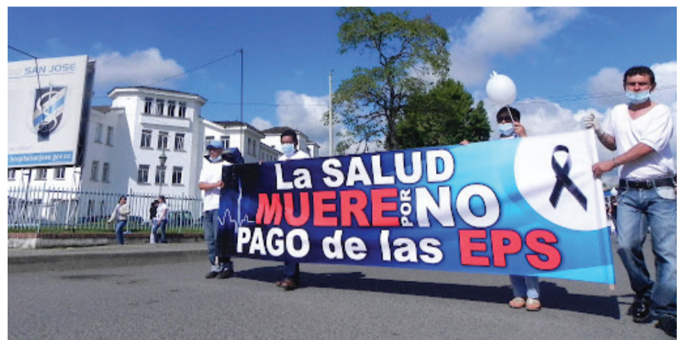
La marcha en Popayán.