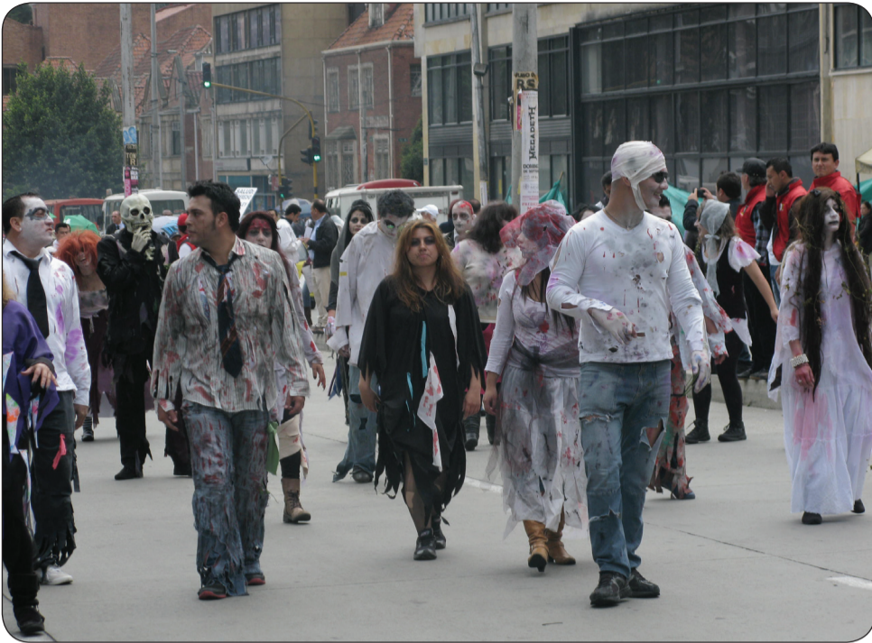
Grupos culturales marcharon dramatizando la crisis de la salud.