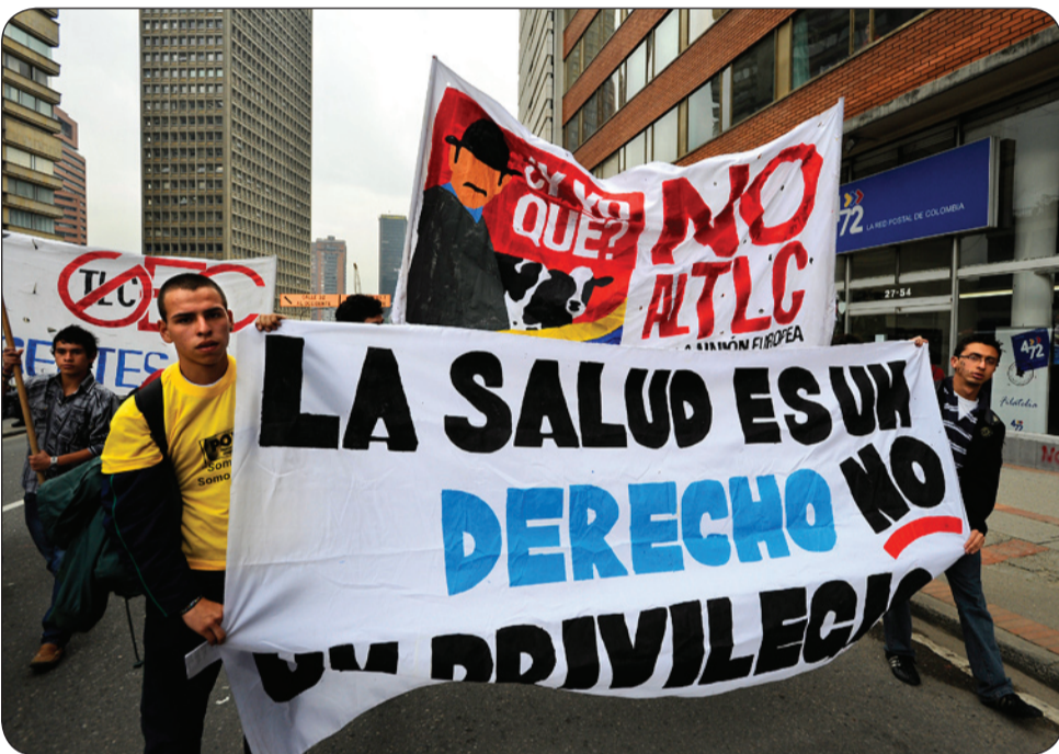
Movilización en las calles de Bogotá.