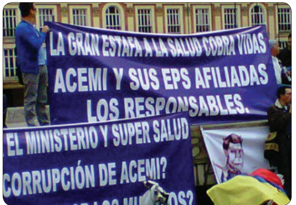
Corrupción, Corrupción, Corrupción, esa es la realidad de la salud.