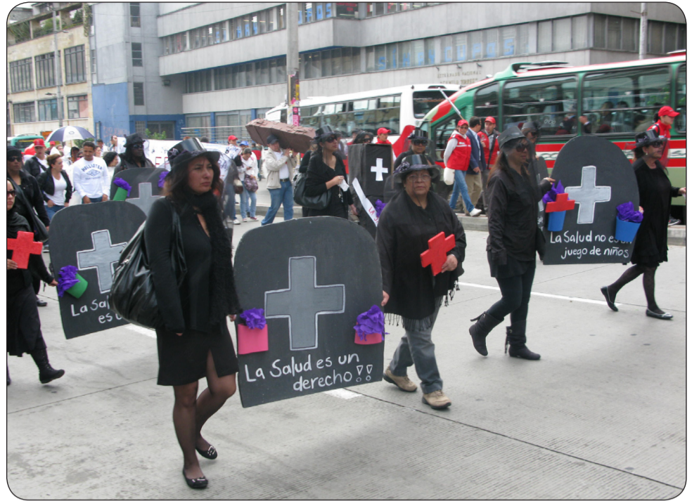
Fúnebre, así está el presente y el futuro de la salud.