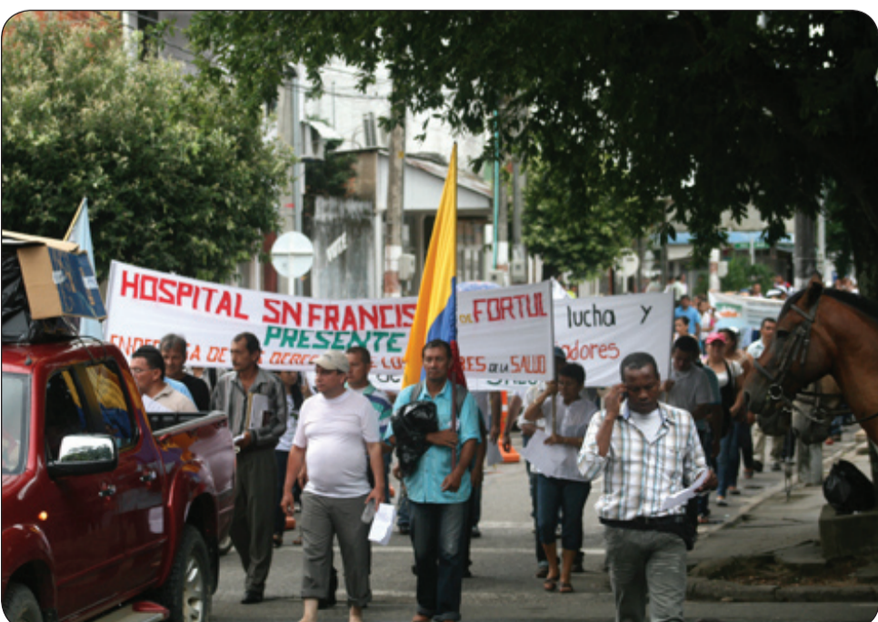
La marcha en Arauca.