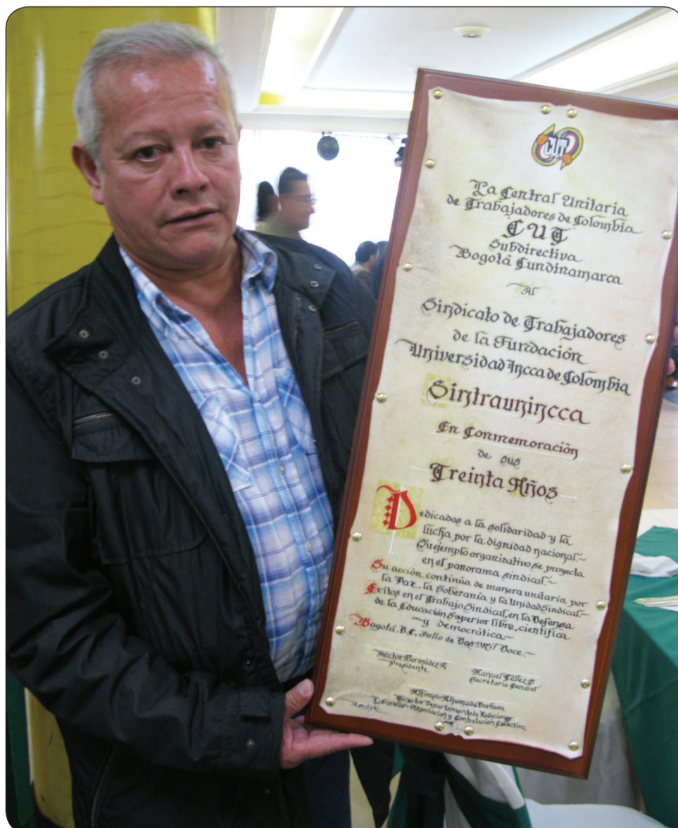
La CUT Nacional y la CUT Bogotá Cundinamarca presentes en la celebración de los 30 años de Sintrauincca.

El Informativo CUT Nacional ha asignado un espacio permanente en el Periódico Informativo CUT Nacional, para publicar los principales conflictos de las Subdirectivas y Sindicatos. Enviar sus aportes a los correos electrónicos: prensacut@cut.org.co o alvelari1@hotmail.com .