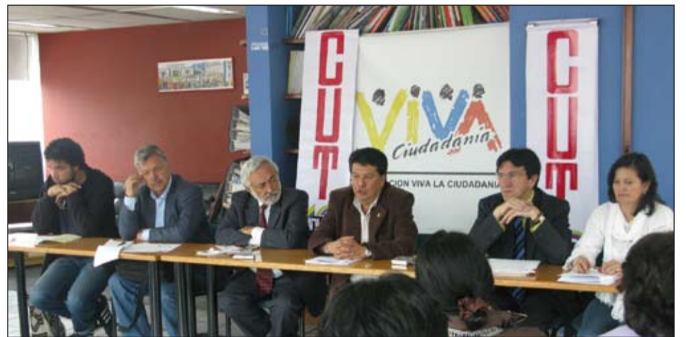
Lanzamiento en la CUT de la Gran Cumbre Social y Política. 5 de junio.