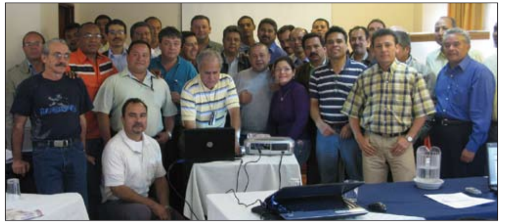
Seminario del Sector Alimentos y Bebidas. 27 y 28 de mayo.