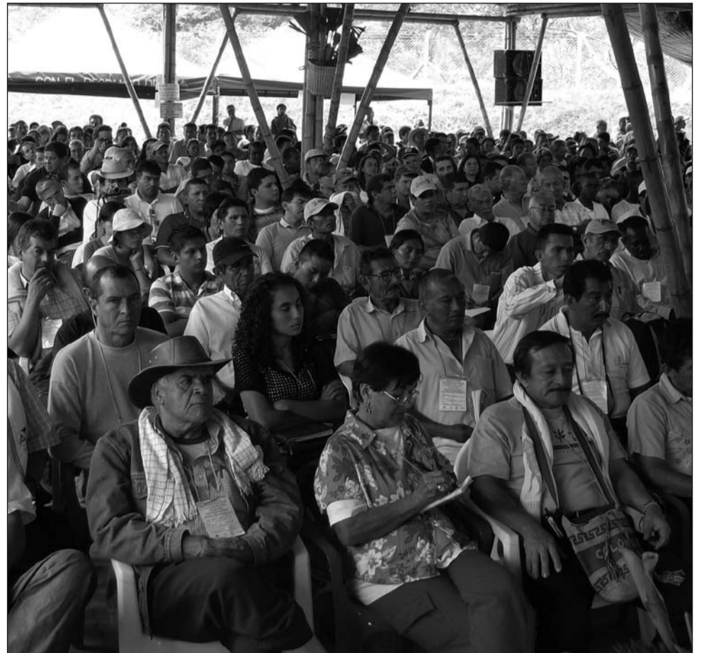
Panorama de delegados (as) al Gran Encuentro Nacional por la Defensa de la Seguridad, la Soberanía Alimentaria y la Producción Campesina y Agropecuaria.

El llamado fundamental del evento, estuvo orientado a promover y fortalecer los procesos organizativos de encuentro y movilización en defensa de la soberanía alimentaria y la producción agropecuaria. Identificar y acordar acciones conjuntas de incidencia y movilización local, regional y nacional por el derecho al reconocimiento y protección de la producción agropecuaria y la alimentación, para el rescate de la auténtica soberanía alimentaria y la confrontación a la influencia expoliadora de las multinacionales de agricultura y alimentos en Colombia.