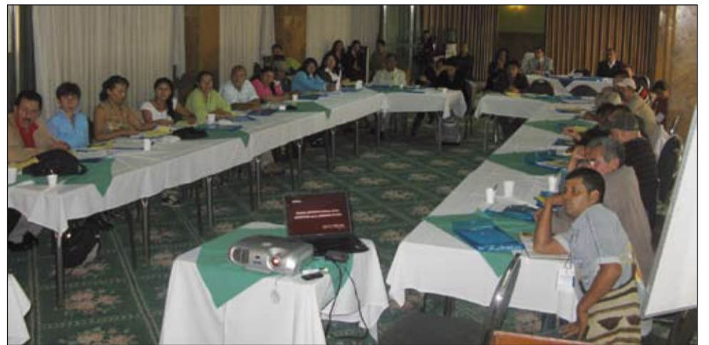
Seminario-Taller en busca de la ratificación del Convenio 184 y consideraciones sobre la Recomendación 192 de la OIT "Seguridad y Salud en la Agricultura". 5 y 6 de junio.