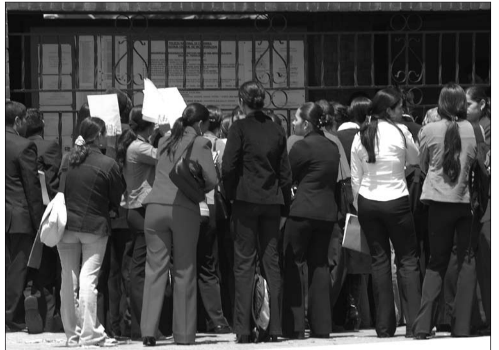
Largas y agobiantes filas para solicitar cita en una EPS.

El punto central aquí es, sin duda, la unificación del POS, fijando como plazo para