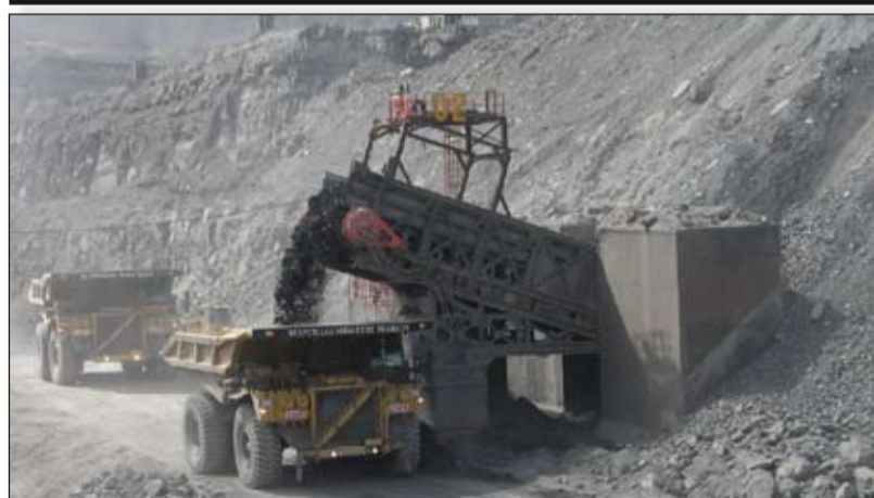
Apron Feeder, equipos de la Drummond, lleva el record de lesionados de la columna.

Es una satisfacción para los trabajadores, lo que se logró en la 98 Conferencia de la OIT gracias a la representación del movimiento sindical colombiano, ya que después de varios días de discusiones entre los representantes de los trabajadores, de los empleadores y de los gobiernos, la Comisión de Aplicación de Normas acordó incluir a Colombia en la lista de los casos de los 25 países que serán examinados por este órgano de control de la OIT.