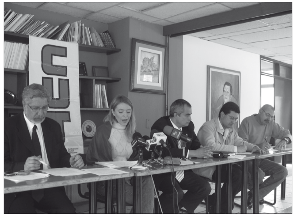
Aspecto de la rueda de prensa sobre la demanda a la Drummond.