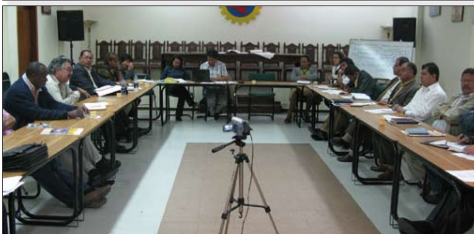
Seminario de Diálogo y Concertación/Convenio DGB-Bildungswerk de Alemania/CUT/CTC. 26 y 27 de mayo.

Igualmente, el compañero participó en la movilización del 1º de Mayo, Día Internacional de los Trabajadores, junto a los compañeros(as) de Comisiones Obreras de España (CC.OO.), la Unión General de Trabajadores (UGT) y otros movimientos sindicales internacionales.