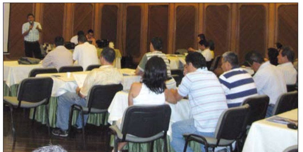
Seminario Regional de Finanzas en el Valle del Cauca. 4 y 5 de junio.