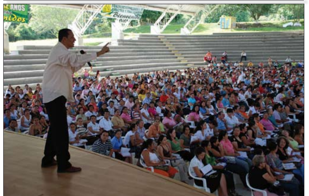
Capacitación docentes del Tolima para el nuevo concurso, realizado por Simatol.