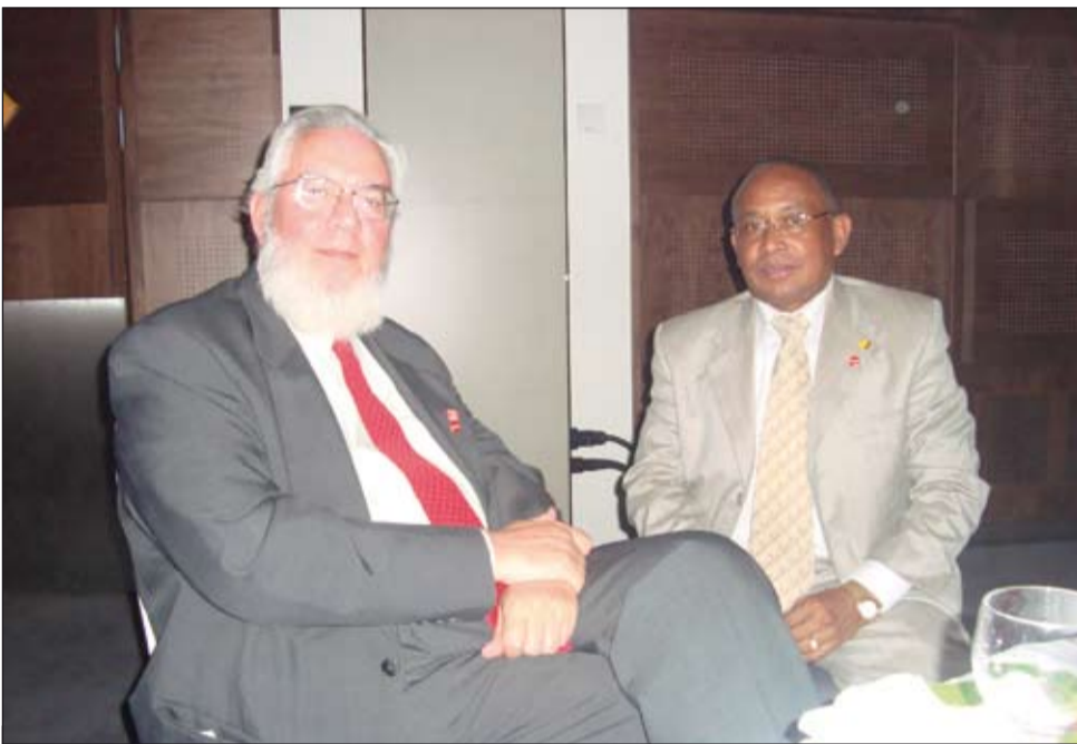
Reunión con Juan Somavia, director general de la OIT.