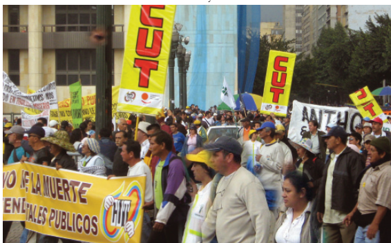
Aspecto de la movilización el 10 de octubre a su entrada a la Plaza de Bolívar en Bogotá.

a los pacientes y ya que se sacrifica la calidad por la contención de costos.