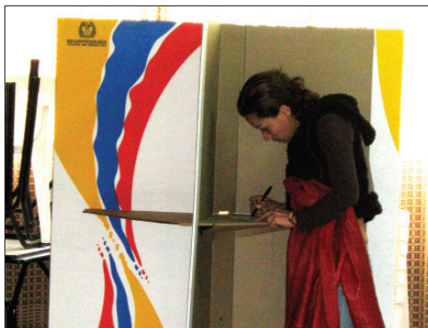
El próximo 28 de octubre es la oportunidad para votar por los candidatos a las Gobernaciones, Asambleas, Alcaldías, Concejos y Juntas Administradoras Locales que apoya la CUT, en esta edición especial reseñamos a quienes durante su trayectoria laboral se han comprometido con nuestra causa social y política; ellos nos representarán y consolidarán como una gran fuerza luchadora y propositiva.