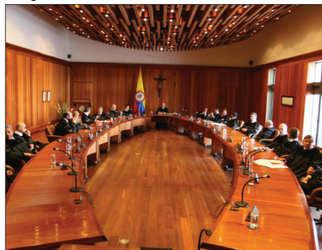
La Central Unitaria de Trabajadores de Colombia (CUT) expresa el respaldo a la Honorable Corte Suprema de Justicia y manifiesta su rechazo a la presión y obstrucción de que viene siendo objeto, para impedir el ejercicio de su actividad profesional e institucional, que sin duda contribuirá, con sus decisiones, a que el destape de la parapoltica tenga sanciones a los implicados en ella.

Procuraduría General de la Nación solicita declarar inconstitucional la Ley 789 de 2002 demandada por la CUT