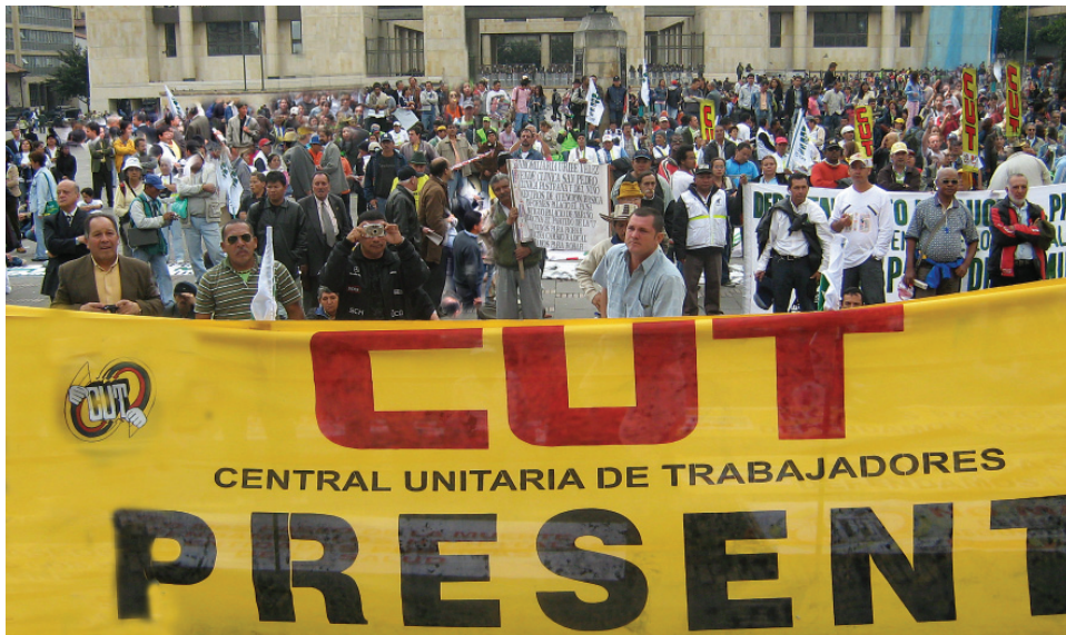
El Comité Ejecutivo Nacional de la Central Unitaria de Trabajadores de Colombia y la Gran Coalición Democrática, decidieron para este segundo semestre del año, poner la problemática del sector salud y la seguridad social, al centro de la movilización, habida cuenta de la arremetida del gobierno de Uribe Vélez, contra sus trabajadores y el cierre y liquidación de las ESE y el Seguro Social, así como los anuncios de nuevas reestructuraciones en la red pública hospitalaria.