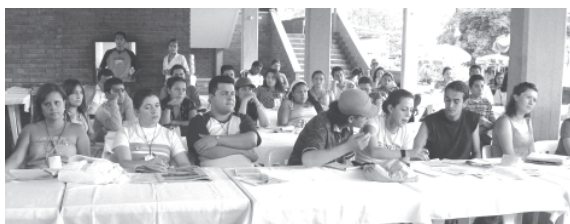
Aspecto del VI Encuentro de la Juventud Trabajadora en Chinautla, Cundinamarca.

E l VI Encuentro Nacional de Juventud Trabajadora encaminó el trabajo organizativo hacia el «I Congreso de la Juventud Trabajadora de la CUT» que se realizará en Bogotá los días 29, 30 de noviembre y 1 de diciembre del presente año y que espera contar con 500 jóvenes trabajadores participantes.