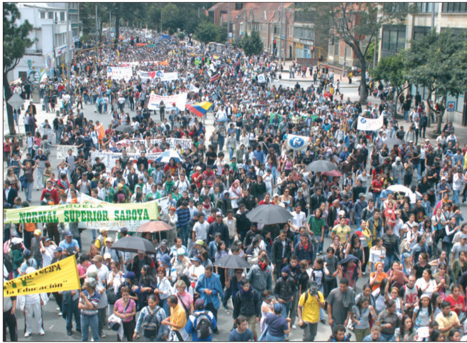
Mobilización del 30 de mayo de 2007 en Bogotá.

Los derechos sindicales se encuentran plenamente protegidos por la Constitución Política de 1991. El Artículo 39 consagra el derecho de asociación sindical, el fuero sindical y las demás garantías necesarias para el cumplimiento de la gestión sindical, por ejemplo, los permisos sindicales. El derecho de negociación colectiva contemplado en el Artículo 55, es de aplicación a todos los trabajadores(as), con las excepciones que señale la ley; es necesario reconocer ante todo el Test de Razonabilidad en materia de igualdad en las limitaciones que imponga la ley. El derecho de huelga consignado en el Artículo 56 presenta una única limitación: los servicios públicos esenciales definidos por el legislador.