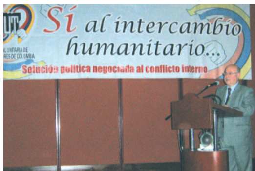
Pacto por la verdad, democracia y acuerdos humanitarios.