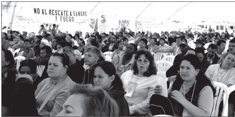
Más de 2.200 delegados de todo el país participaron en el evento.

Por ello estamos convencidos(as) de que la victimización de millones de colombianos no