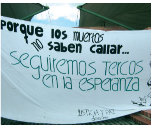
Encuentro Nal. de Víctimas de Organizaciones Sociales.