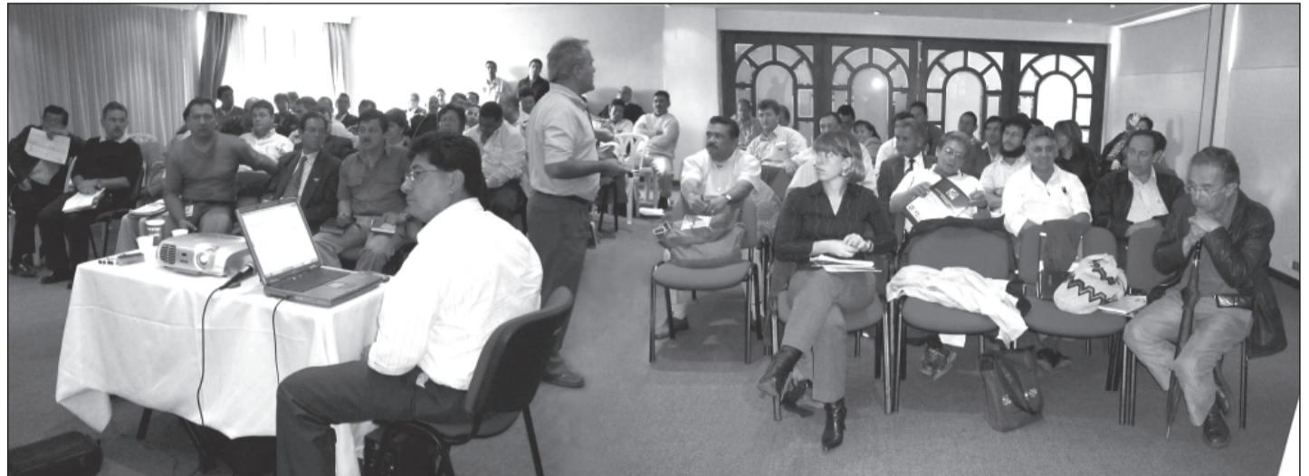
Seminario Nacional de Sindicatos de Rama de la Actividad Económica o de Servicios.

En esta dirección, el Comité Ejecutivo tomó la decisión de reforzar la Secretaría