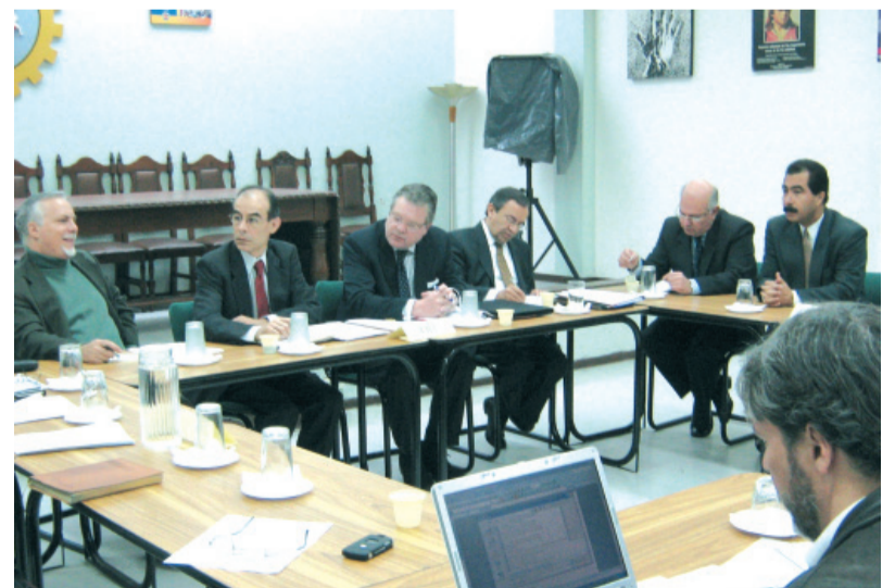
Pre- Misión de Alto Nivel de la OIT.

10 DE OCTUBRE: GRAN MOVILIZACIÓN NACIONAL ¡Por toda la verdad, la democracia y las garantías!