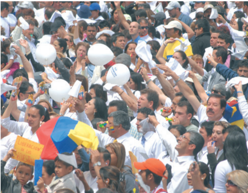
Colombia clama por el acuerdo humanitario.