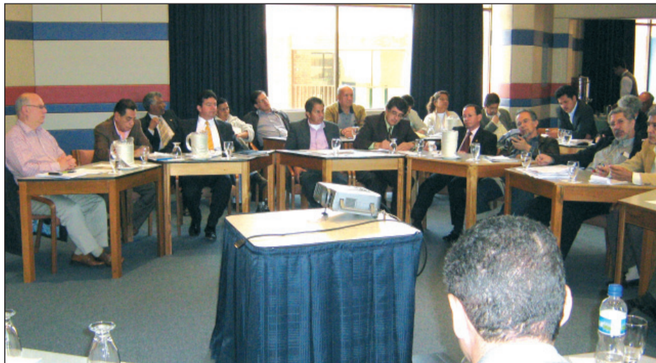
Reunión de las centrales sindicales preparatoria de la visita de la OIT.

Hoy podemos afirmar categóricamente que estamos frente a una masacre laboral producto de la aplicación de políticas gubernamentales contrarias a los convenios internacionales de la OIT ratificados por Colombia y frente a un genocidio contra el movimiento sindical, en donde el Gobierno Nacional tiene una alta responsabilidad. Por esta razón debe entregar sus explicaciones ante la Misión de Alto Nivel de la OIT, fundamentalmente porque el grado de impunidad continúa por encima del 95% lo cual permite que los actores de la violencia sigan actuando en contra de la dirigencia del movimiento sindical.