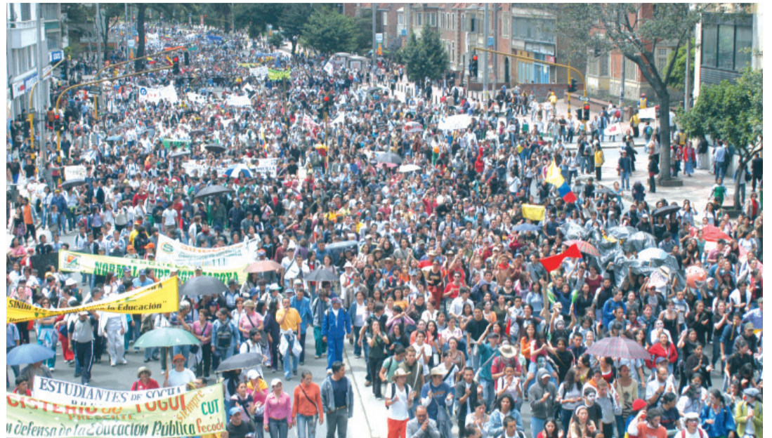
Gigantesca movilización en Bogotá el pasado 30 de mayo, contra el recorte a las transferencias.