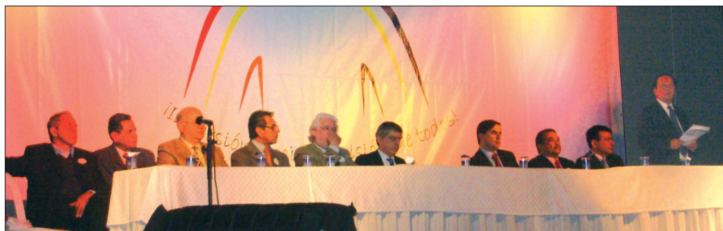
Aspectos del lanzamiento del referendo, el pasado 16 de agosto en Bogotá.

El 16 de agosto arrancó en firme la segunda fase del Referendo Constitucional para garantizar la educación, la salud, el agua potable y el saneamiento básico. El lanzamiento formal de la campaña por la recolección de tres millones de firmas se efectuó en Bogotá, en el auditorio central de Corferias, con la presencia de más de setecientos dirigentes políticos, sindicales y comunales, convocados por el Comité de Promotores bajo el lema: «Inversión social, decisión de todos».