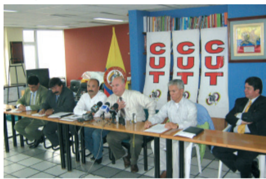
La CUT ratifica su posición civilista y democrática.