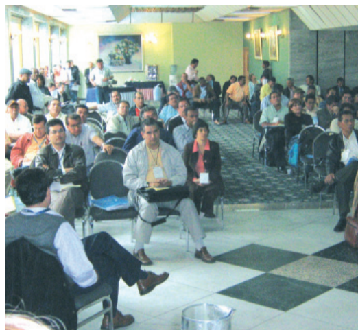
Delegados a la XLI Junta Nacional de la CUT.