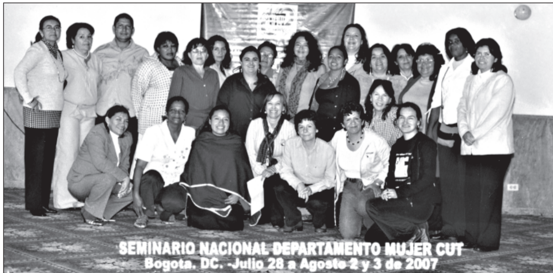
SEMINARIO NACIONAL DEPARTAMENTO MUJER CUT Bogotá, DC. - Julio 28 a Agosto 2 y 3 de 2007

Bolivia: Central Obrera Boliviana (COB); Colombia: Central Unitaria de Trabajadores (CUT), Confederación General del Trabajo (CGT), Confederación de Trabajadores de Colombia (CTC); Ecuador: Confederación Ecuatoriana de Organizaciones Sindicales Libres (CEOSL), Confederación Ecuatoriana de Organizaciones Clasistas Unitarias de Trabajadores (Cedocut); Perú: Confederación General de Trabajadores del Perú (CGTP), Confederación de Trabajadores del Perú (CTP), Central Unitaria de Trabajadores del Perú (CUT); Centrales venezolanas fraternas: Confederación de Trabajadores de Venezuela (CTV), Central Unitaria de Trabajadores de Venezuela (CUTV), Confederación General de Trabajadores (CGT), Confederación de Sindicatos Autónomos de Venezuela, (Codesa).