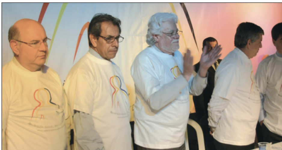
Comité Promotor del Referendo.

El Referendo Constitucional es, además, la voz de las comunidades y de los mandatarios seccionales que no tuvo eco en el Congreso de la República. Es la voz de la esperanza por una nueva Colombia.