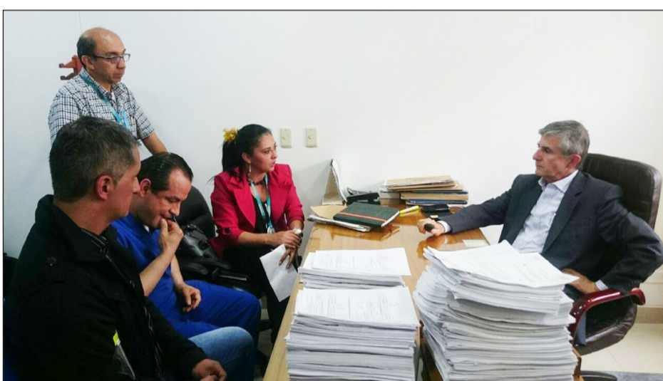
Trabajadores del Hospital de Kennedy en conversaciones con el secretario distrital de Salud.